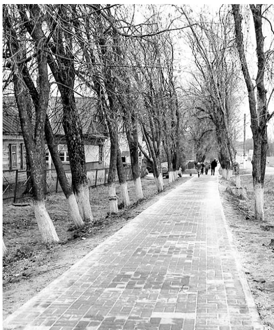
Новый тротуар к школе и детскому саду.

от ул. Школьная до детского сада «Улыбка». В этом году прошло расселение семей из аварийного дома в новый – красивый, благоустроенный, ставший украшением поселка.